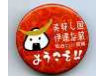
「伊達」をイメージした濃い赤色