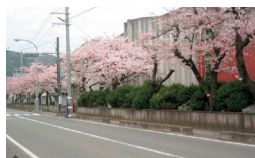
●校舎を囲む被災木（被災前）