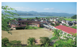
●自然に囲まれた大川小学校（被災前）

私たちにできることはなんだろう。 かけがえのない命を守るために。 未来へつなぐために。