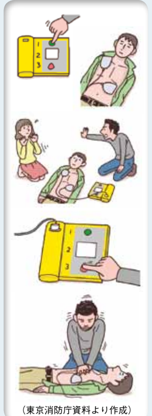
(東京消防庁資料より作成)