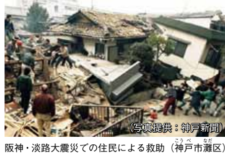
阪神・淡路大震災での住民による救助

災害直後は、救助に必要な道具がすぐ近くにない場合があります。そのようなときは、別なもので代用して救助を行えることも覚えておきましょう。また、救助中に危険が伴う場合もあるので、その時には安全が確保されたあとに救助の協力をするようにしましょう。