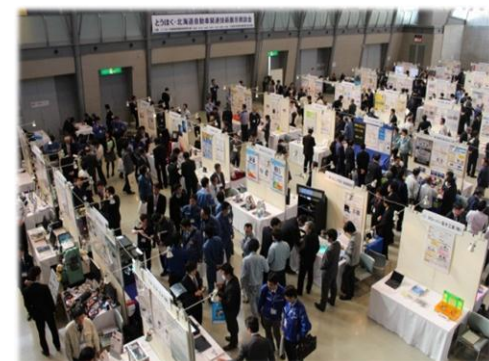
<参考>とうほく・北海道自動車関連技術 展示商談会(H27.2.5-6 刈谷市)