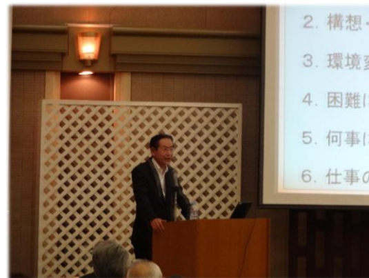
<参考>平成26年度次世代経営セミナー(H26.9.17)

基礎的勉強会(コスト・原価・TPS等), 技術セミナー, 先進事例セミナー等, 受講対象者を絞り込んだ 形式での開催を予定(年4回程度)