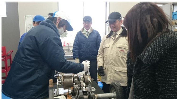
＜参考＞アクア部品技術研修