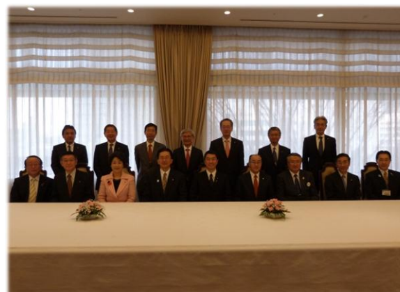
＜参考＞東北各県知事によるトップセールス (H27.2.5)