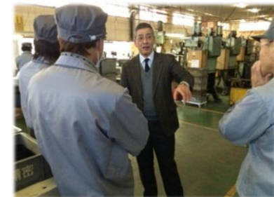
＜参考＞生産現場改善支援事業

学生の自動車産業に対する理解や関心の向上を図るため、開発設計分野を中心とした人材育成講座を実施