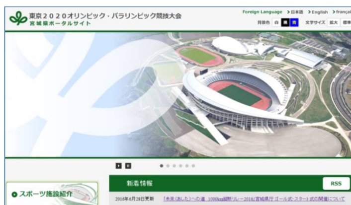
東京2020オリンピック・パラリンピック競技大会宮城県ポータルサイトURL

また、ウェブページを多言語化し、県内のスポーツ施設に関する情報の発信を行うことにより、市町村の行う事前キャンプの誘致を促進するとともに、県内の観光・復興情報に関するウェブページのリンクを掲載し、宮城県内の情報を広く国内外へと発信します。