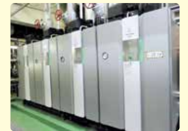
導入された高効率ボイラ