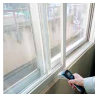
既存窓への内窓追加