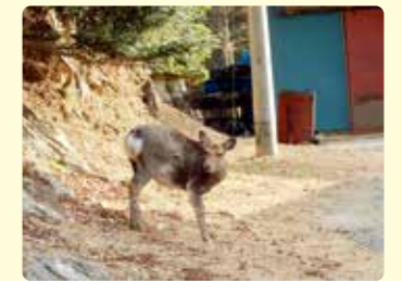
住宅地に出没したニホンジカ