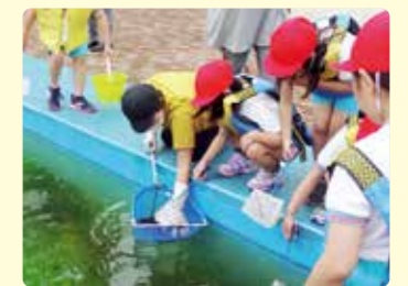
こども環境教育出前講座