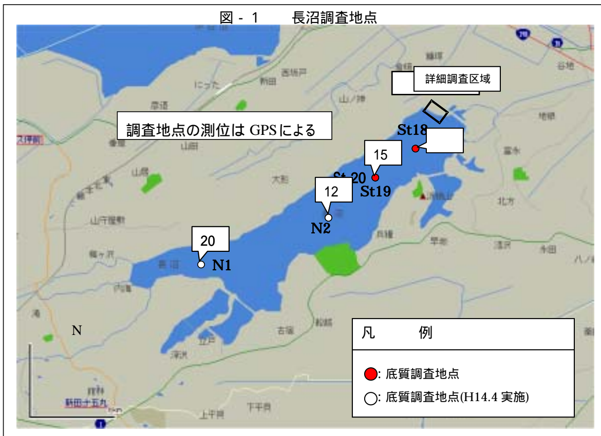
図 - 1 長沼調査地点