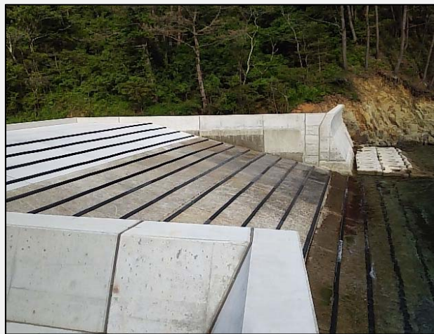
斜路工 および 護岸工(東側)