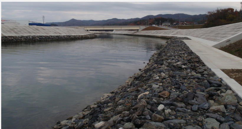
左岸河口部(一部を除く)は、完成しました。