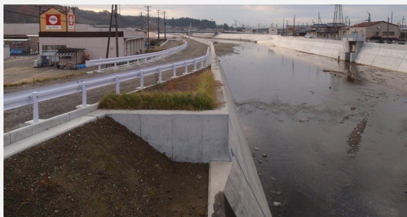
国道45号下流側は、両岸とも完成しました。