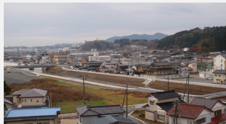
国道45号上流側は、両岸とも完成しました。