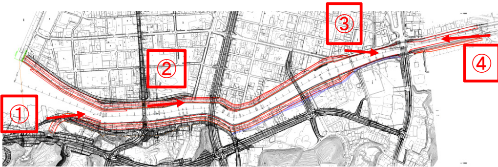
① 着手前 平成25年4月