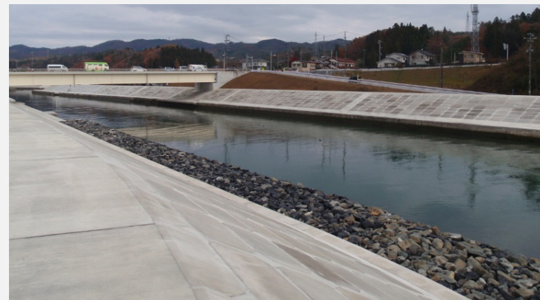
浪板橋付近は、両岸とも完成しました。