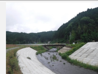
着工前 (右岸No.0.5より上流方向撮影)