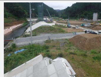
着工前 (左岸NO.0+30より上流方向撮影)