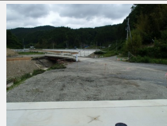
着工前 (左岸NO.0.6より上流方向撮影)