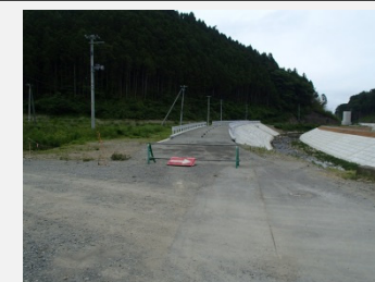
着工前 (左岸NO.1.2より下流方向撮影)