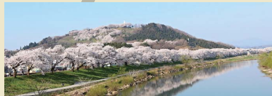
白石川堤と船岡城址公園