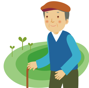
写真は恥ずかしいのでごめんね