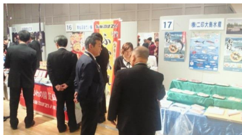
（三陸求評見本市での商談の様子）