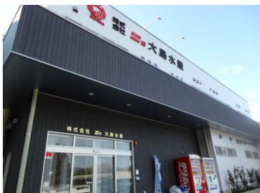
（高台に復旧した新工場）

被災水産加工業の業績回復に向けた課題は山積していますが、水産の街気仙沼の復興を目指して、取組みを進めていきます。