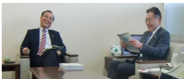
菊地岩沼市長（左）と橋本公営企業管理者（右）

意見交換でいただいた提言は、今年度策定予定の「水道事業経営管理戦略プラン」などの施策に反映させる予定です。「首長さんとの水談義」は今後も継続して開催していく予定です。