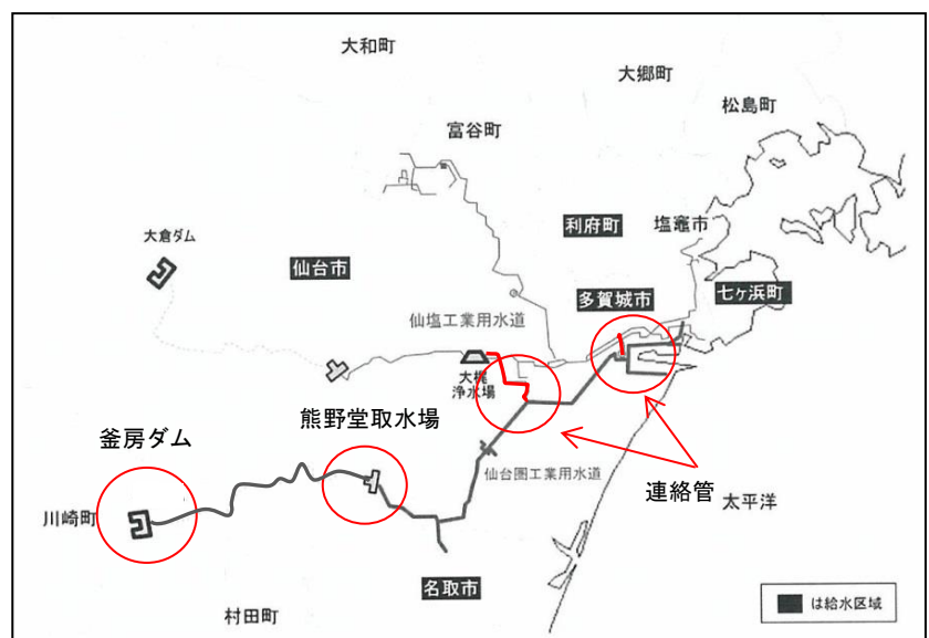
仙台圏工業用水道事業概要図

仙台圏工業用水道と仙塩工業用水道は、配水区域・管路が近接しているため、それぞれを連絡管により連結しており、水質事故等の非常時に用水の相互利用が可能となっていることが大きな特徴となっています。