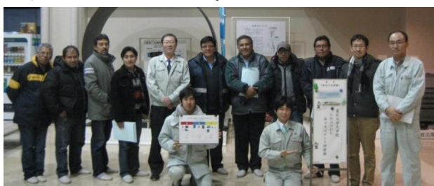
研修員と付添の方々と仙南・仙塩広域水道事務所職員

最後に「利き水」を行い、南部山の水とミネラルウォーター2種類のおいしさを飲み比べていただいたところ10名中4名の方に広域水道の水がおいしいと答えていただけました。