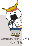
宮城県観光PRキャラクター むすび丸

伊達な旅紀行 いいとこ! みやぎ 毎週月曜日 よる7時54分 BS-TBSにて大好評放送中