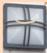
兜の前立 アーケードの 入口