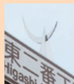
兜の前立 青葉通東二番町の 標識