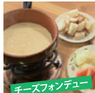
チーズフォンデュ