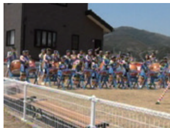
年3回市内のお祭りや神社の祭典などで披露