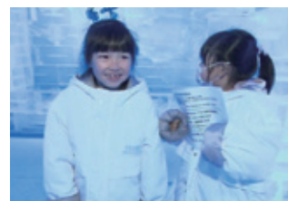
館内はマイナス20度!コートを借りて見学