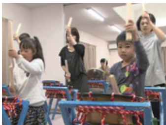
子どもたちが小太鼓、お母さんが大太鼓を担当

波板虎舞は「虎は千里行って千里帰る」という言い伝えにちなみ、遠方に漁に出る漁師の安全を祈願。家人の魔除け、厄払いとして、波板地区内の飯綱神社と須賀神社に奉納されています。