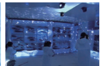
氷に映像を投影するプロジェクションマッピングも人気!