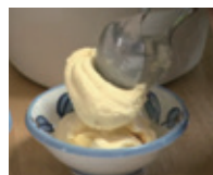
大島の特産品のひとつ、ユズを使ったアイスクリーム作りに挑戦!