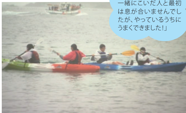
ライフジャケットを着用し、ペアで大島の海へ。

「シーカヤック初体験!一緒にこいだ人と最初は息が合いませんでしたが、やっているうちにうまくできました!」