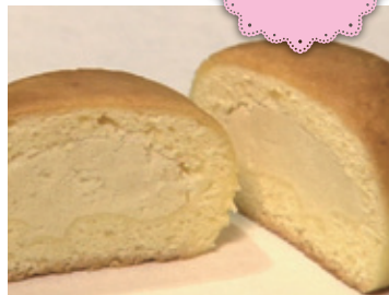
和梨を使った白餡を、米粉が入った生地で作った焼菓子