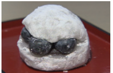
ブルーベリー大福