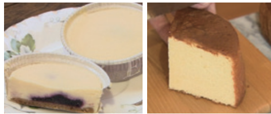
とみやフロマージュ