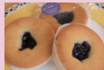
ケーキハウス白いオルゴール「とみやの雫(ブルーベリーチーズケーキ)」