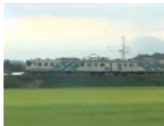
蔵王連峰を望みながらの田園風景の中を走り抜けます