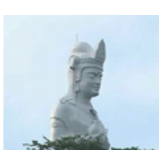
船岡城址公園にある「船岡平和観音」