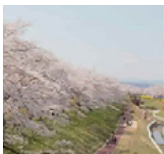
ひとめせんぼんざくら 桜の名所である「一目千本桜」は、町のシンボリック的存在です