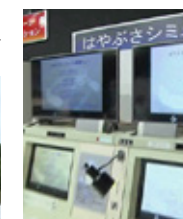
子供も楽しめる体験コーナー

宇宙開発の町として知られる角田市には、JAXA(宇宙航空研究開発機構)の研究施設があります。