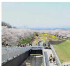
せんおうきょう 「しばた千桜橋」から眺める風景は圧巻です