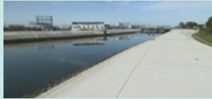
復旧後、現在の砂押川堤防