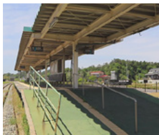
駅のホームは、震災遺構として残されることになりました。