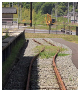
地震と津波で曲がったレール。