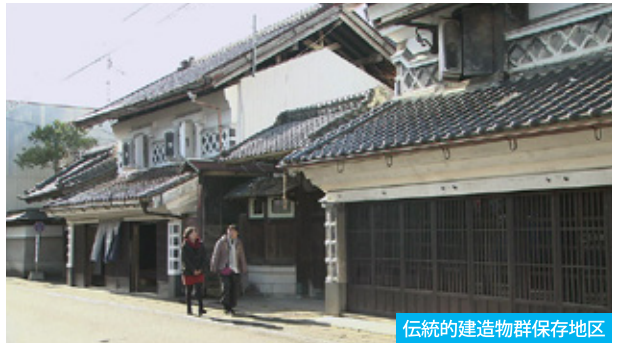
伝統的建造物群保存地区

江戸時代の建物が残されている村田町。情緒あふれる街並みを散策しながら、この町ならではの酒を味わってみませんか。