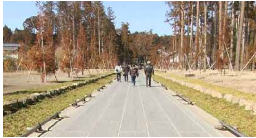
門から本堂までの参道は、津波による塩害で、杉が伐採されていましたが、きれいに整備されました。

日本三景松島。松島の魅力は景色だけではありません。修理を終えた瑞巖寺を訪れ、周辺を散歩してみてもいいですか。