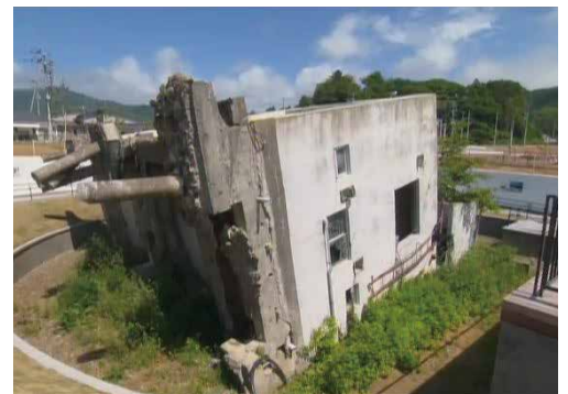
震災の教訓を今に伝えている震災遺構旧女川交番。横断しの建物が当時の状況を物語っています。