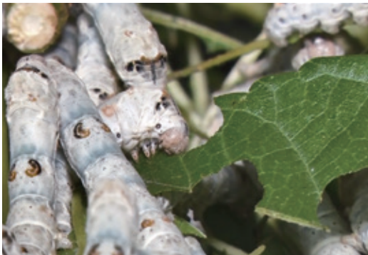
蚕の天敵であるネズミを退治する猫は、「猫神様」として大切にされていました。

江戸時代から 養蚕業で栄えた 丸森町。そんな丸 森町でおいしくて 楽しい猫神様めぐ り、いかがですか。