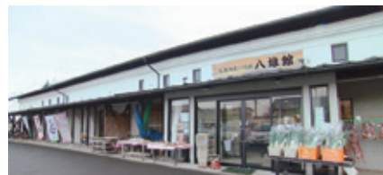
農家の方が毎朝とれたての新鮮野菜を持ち込む町の台所です。