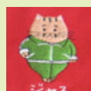
「ジャス」を 表す「ジャス」

「とらちゃんの丸森弁シリーズ」が話題。丸森町の人たちが使っている宮城の方言を猫神様のキャラクター「とらちゃん」がつぶやきます。