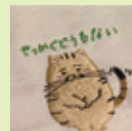
「せっかぐどう もない」