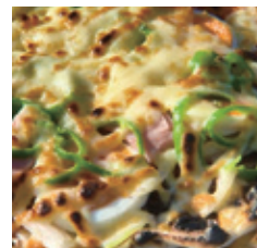
猫神様ならぬ、猫窯様で焼いたピザ。