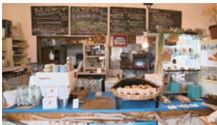
川のほとりに佇むコーヒースタンド。