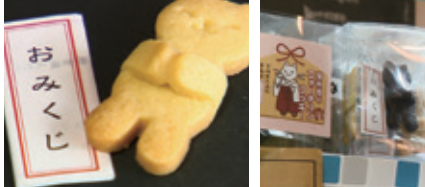
丸森町にある神社の協力を得て作られています。