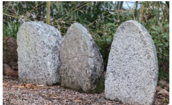
森町には猫神様が刻まれた石碑が町のいたる所にあります。その数は、およそ80基以上。