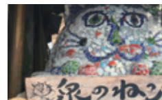
「猫釜様」は、町の人の交流の場として、あぶくまの里山を守る会の人たちが作りました。