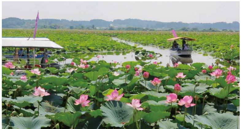
伊豆沼・内沼。渡り鳥の生息地である湿地を守るための国際的な決まり『ラムサール条約』にも指定されています。8月にはハスの花が一面に咲き誇ります。