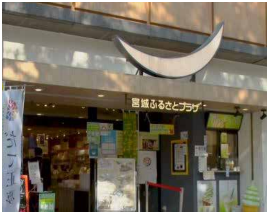
店内全体でおおよそ1500種類の商品を取り扱っています。