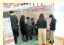
環境イベントの様子

出前講座やイベントなどによる環境教育や広報を通じて、人材育成などに取り組みます。ロボット技術などの最新技術を取り入れた廃棄物処理の高度化、効率化の取り組みを促進します。