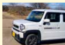
不法投棄等パトロール車両

不法投棄防止の広報・啓発の実施、違反行為の早期発見および早期対応、法令遵守に関する指導の徹底などに取り組めます。