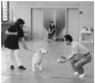
イヌのしつけ方教室(栗原保健所)