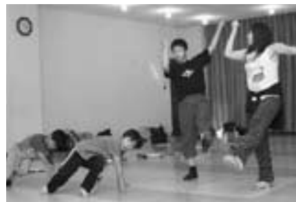
地元の小学生から高校生までの団員で構成される演劇塾うを座。本番に向けて練習が続いています