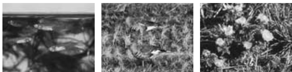
メダカ 県内では、阿武隈川、名取川、七北田川、鳴瀬川、北上川水系などに生息しています。開発や河川・用水改修による生息環境の悪化が見られるほか、ブラックバスなどの害害による減少が心配されています。 マガン 国の天然記念物に指定されており、宮城県の鳥にもなっています。伊豆沼・内沼などをねぐらとしていますが、安全なねぐらや餌場が確保されないと渡来規模が縮小するおそれがあります。 フクジュソウ 正月を飾る花として知られており、県内各地の里山に生育していましたが、開発が進んだため生育地や個体数が減少してしまいました。また、園芸植物として乱獲されたことも影響しています。

宮城県は、豊かで多様な自然環境に恵まれています。この豊かな自然は、多種多様な野生動植物を育んできました。しかし、都市化や工業化が進み、以前は身近に見られた動植物が減少し、中には絶滅のおそれがある種もでてきています。このため県では、県内の野生動植物の現状を調査し、「宮城県の希少な野生動植物 宮城県レッドデータブック」(平成十三年三月)として取りまとめました。 宮城県の希少な野生動植物 宮城県では、貴重な野生動植物の現状と緊急に保護することが必要な野生動植物の種類を明らかにするため、平成八年度から五年間かけて調査を行いました。調査は、植物、哺乳類、鳥類、両生類・爬虫類、汽水・淡水魚類、昆虫類のほか、動物が生息・生育する空間である植物群落や干潟なども対象としました。 この結果をまとめたものが、宮城県の希少な野生動植物 宮城県レッドデータブックです。 「宮城県の希少な野生動植物(普及版)」(五百五十円)は県政情報センター(2022)「211」で販売しています。 県内で絶滅のおそれがあるのは1305種 調査の結果、県内で絶滅のおそれがあるのは、植物五百四十七種、鳥類六十二種、昆虫類六百四十九種など千三百五種に達することが明らかになりました。