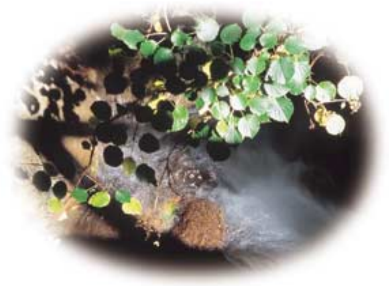
沢に映し出される緑が光と影に和む

この光と影が二口に集められて、やがて名取川となる。 こんな素晴らしい水景色は日本中探してもあまりないのでは。