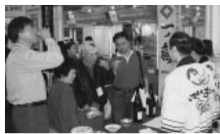
海外で日本酒の魅力PR (平成18年11月ソウル国際食品展示会)

ものを売ることは海外も日本も同じです。良いものを適正な価格で提供し、お客さまに楽しんでいただくことが大切です。地元から愛されないものは海外でも生き残ってはいけません。これからは海外でも生き残ってほしいですね。これからは地元を大切にしながら、海外に日本酒の魅力を伝えていきたいと思っています。