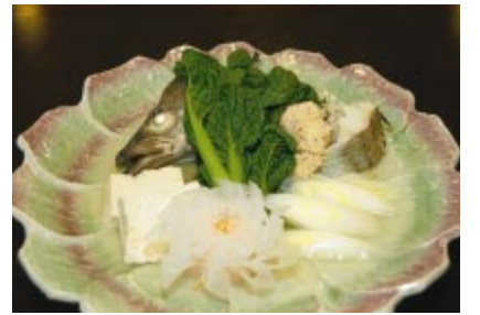
ちぢみ雪菜とたららの潮煮(うしおに)