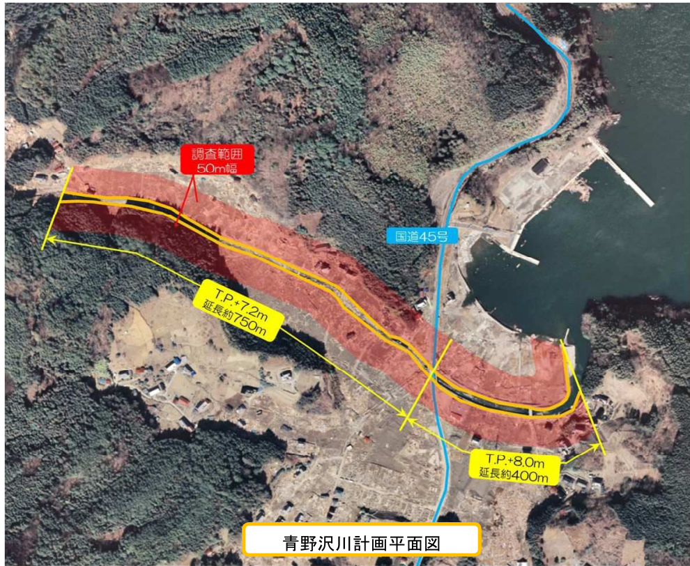
青野沢川計画平面図