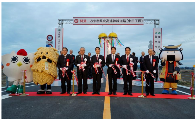
( 開通式の様子 )