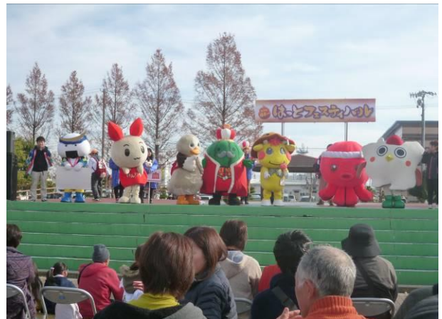
↑ステージイベントの様子

（右から、はっとン、オクトパス君、みやとめさん、ジャンボ〜ル3世、パタ崎さん、けんけつちゃん、むすび丸）