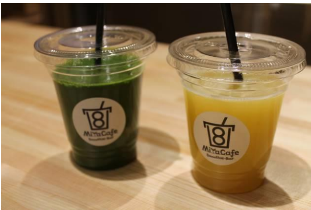
青果店で販売しているスムージー