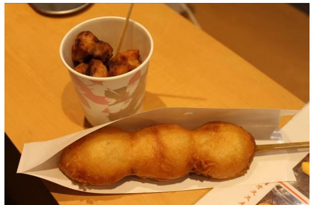
メカジキの唐揚げ，揚げかまぼこ

また、「拓」の向かいには、商業施設の「結（ユワエル）」が営業を始めており，雑貨店やラーメン店，惣菜店，カフェ等が出店しています。