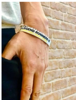
2019 シリーズシリコンバンド

県南レジェンドランナーズにエントリーした方は「チャレンジャー」と呼ばれ、エントリー者全員に大会で身につけるシリコンバンドをプレゼントしています。身につけて参加することでチームとしての一体感を感じることができます。