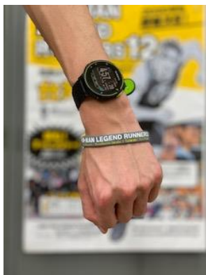
2020 シリーズシリコンバンド