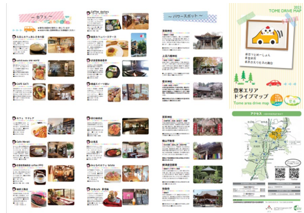
【ドライブマップ表】

https://www.pref.miyagi.jp/site/kouiki-tome/tomedrivemaph0404.html