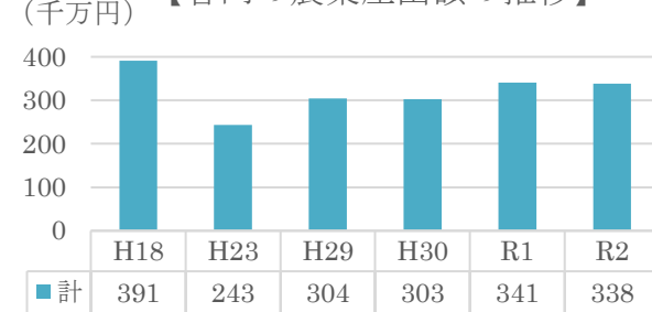
【農業産出額】(気仙沼市及び南三陸町) [千円]