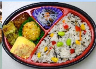
ひじき酢飯とメカジキハンバーグ弁当