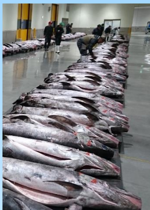
魚市場に並ぶメカジキ