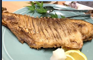
ハーモニカの塩焼き

また、地元高校生が考案し、期間限定で販売されるお弁当に、メカジキが用いられるなど、メカジキを美味しく調理する食文化が醸成されています。