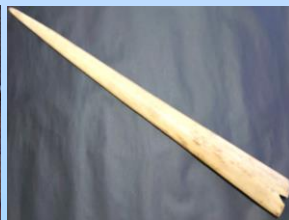
メカジキの吻(乾燥後)