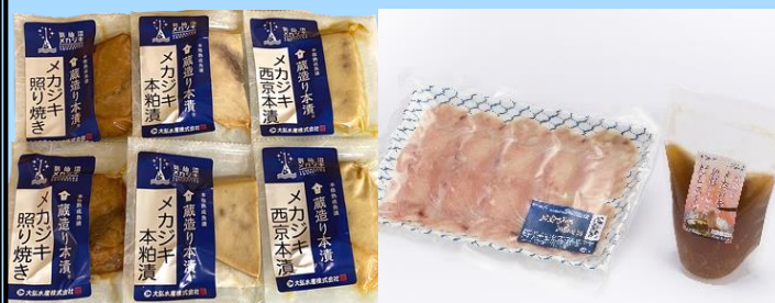
蔵造り本漬® グリル 気仙沼産メカジキセット 気仙沼メカしゃぶセット

品評会で農林水産大臣賞や水産庁長官賞などを受賞した商品も多数あります。是非気仙沼のメカジキをご堪能ください。