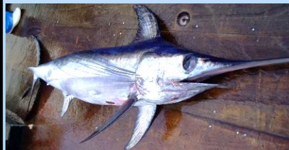
漁獲直後のメカジキ