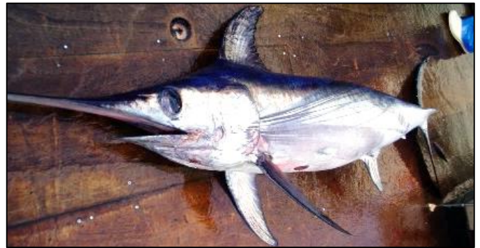
漁獲直後のメカジキ

カジキの仲間にはほかにマカジキやクロカジキなどがありますが、メカジキはメカジキ科、それ以外はマカジキ科に分類され、見た目的にも腹びれやウロコが無いなど、マカジキ科にはない特徴があります。