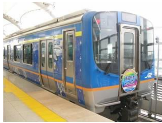
▲過去の大賞作品のラッピング列車

小学生以下の児童に電車のラッピングデザインを応募いただき、優秀作品には記念品が進呈される他、大賞 2 名の応募作品を仙台空港アクセス鉄道車体にラッピングし、表彰するイベントです。