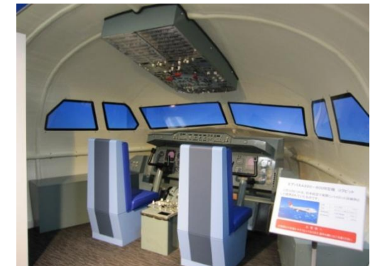
▲エアポートミュージアム (エアバス A300-600R コックピット)