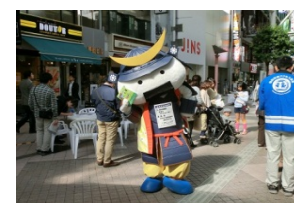
▲スタンプラリーを楽しむむすび丸