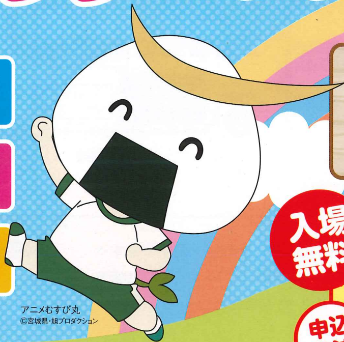
アニメむすび丸