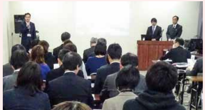
〈塩竈市教育委員会 幼保小連絡会議〉

塩竈市の取組のモデルとなった先進地から講師を招き保幼小だけではなく小中高までの連携や接続に関する取組について研修を行った。