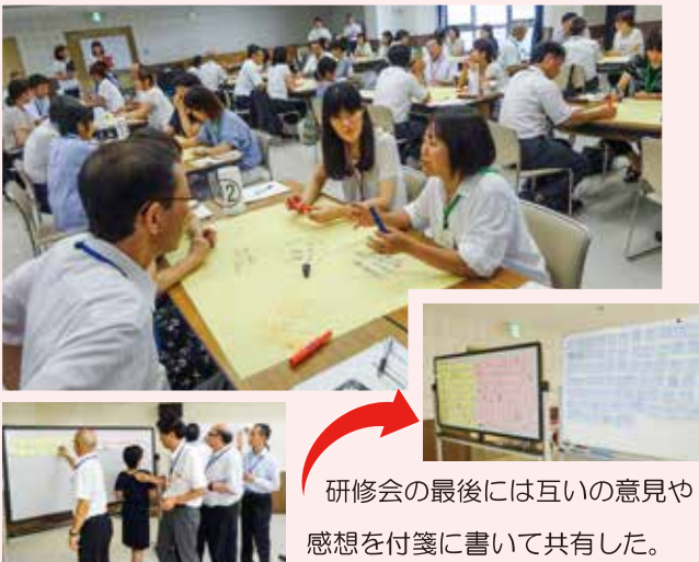
〈大河原教育事務所 保幼小合同研修〉