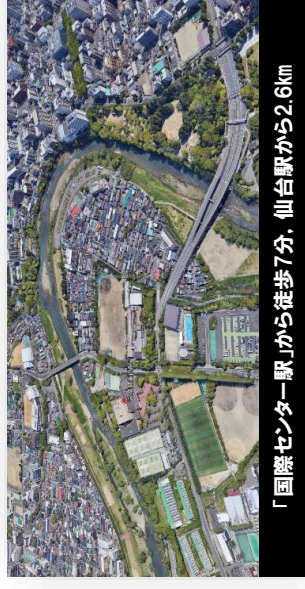
「国際センター駅」から徒歩7分, 仙台駅から2.6km