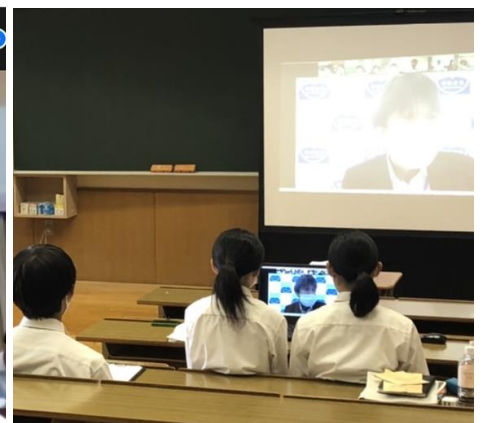
富谷高校でのオンライン参加の様子