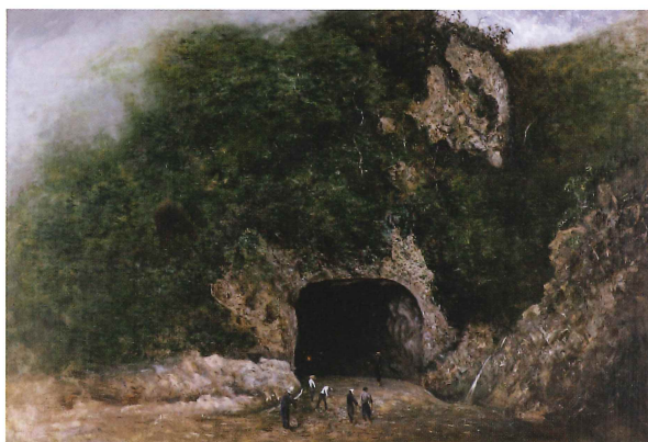
高橋由一《栗子山隧道》明治14年(1881)