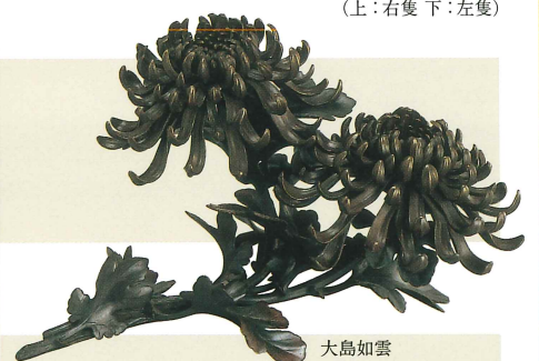
大島如雲 《菊折枝置物》 昭和3年(1928)