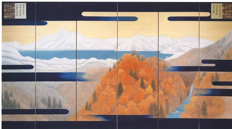
東山魁夷《平成度 悠紀地方風俗歌屏風》(左隻) 平成2年(1990) 後期展示