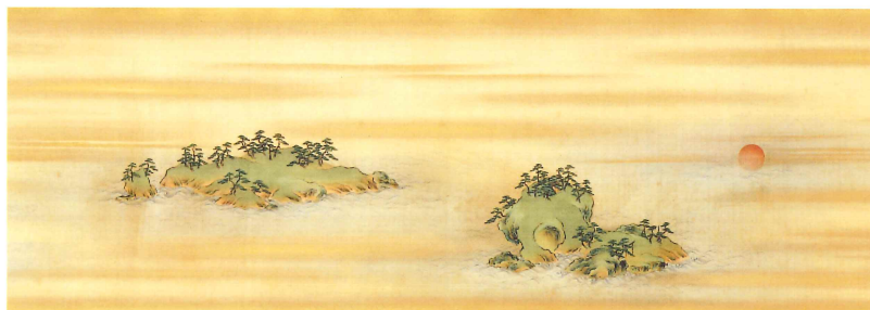
住吉広守《塩松八景図巻》(部分) 江戸時代(18世紀)

同館が所蔵する美術工芸品は、近代以前より皇室に伝えられてきた貴重な品々のほか、明治時代以降に宮殿の調度として飾られたもの、御下命により制作されたもの、展覧会でお買い上げとなったもの、ご即位等皇室の御慶事に献上されたものなど、近代日本美術の貴重な作品が多く含まれています。同館の全面的な協力を得て開催する本展では、その所蔵作品の中から、明治・大正期の洋画や近代日本画の優品を展示するとともに、東北にゆかりのある絵画・彫刻・工芸作品も加えて約50点を紹介いたします。この機会に皇室ゆかりの作品をご覧いただくとともに、皇室と東北との繋がりを感じてください。