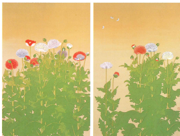
土田麦穂《罌粟》昭和4年(1929) 前期展示