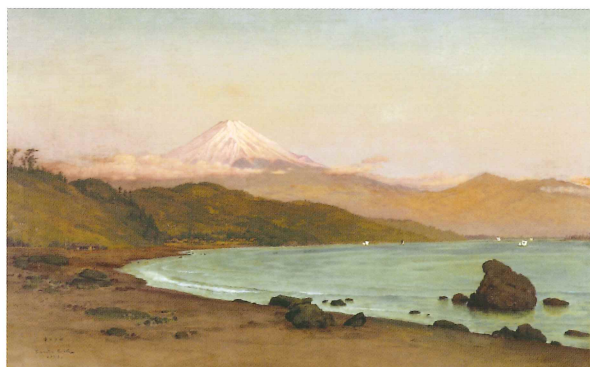
五姓田義松《田子之浦》明治25年(1892)