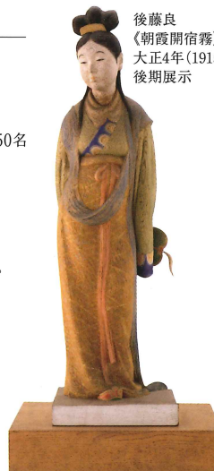
後藤良《朝霞開宿霧》大正4年(1915) 後期展示