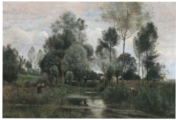
ジャン=バティスト・カミーユ・コロー《春、柳の木々》油彩/カンヴァス、Inv. 922.7.1

宮城県美術館 The Miyagi Museum of Art 〒980-0861 仙台市青葉区川内元支倉34-1 TEL.022-221-2111 http://www.pref.miyagi.jp/site/mmoa/ Twitter miyagi_bijutu