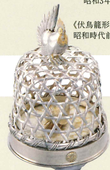
《伏鳥籠形ボンポニエール》 昭和時代前期