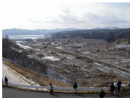
【津波が襲った後の南三陸町】

第一波が引いた頃、余震が弱くなったので、生徒を体育館から各教室に移動させた。その後、第二波が町を襲った。町全体が湖と化し、水面は異様なほど平らになり、鏡のように見えた。第二波は第一波より高さスピードがあり、町全体をみるみるうちにすっぽりと覆ってしまった。その光景を教室から出てテラスで見ていた生徒もいた。