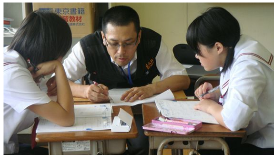
【3年生対象の夏季学習会】