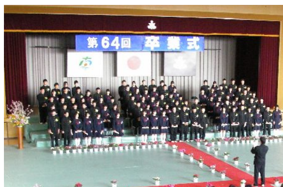
【停電でマイクを使わない卒業式】