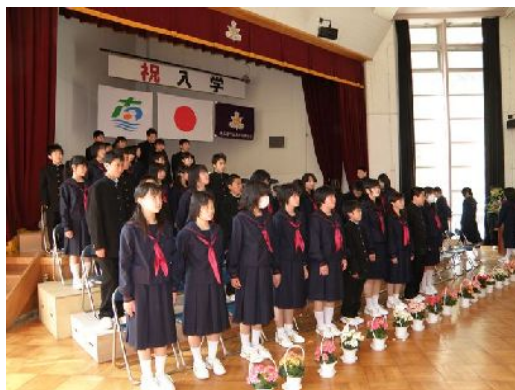
【一か月遅れの入学式】