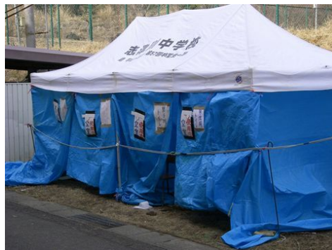
【大使用に設営した野外トイレ】

ウ 学校の物品がどこに何があるのか職員が知っていたので避難者への要望にもすぐに応えられた。