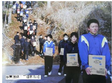
【支援物資を運搬する生徒】