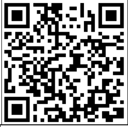
検証改善委員会報告書