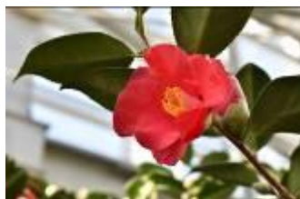
三陸・大船渡第24回つばきまつり イベントスケジュール (●：実施日 ◎：事前予約必要)

世界の椿館・基石では新型コロナウイルス感染症対策を実施したうえで、皆様のご来場をお待ちしております。