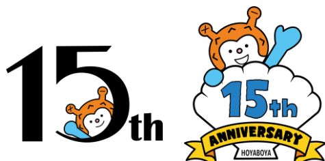
15周年記念デザイン

そんなご当地キャラホヤぼーやは、今年7月に誕生から15周年を迎えることとなり、これを記念した15周年記念企画が発表され、第1弾として「記念デザイン」及び「公式WEBサイト」が公開されました。